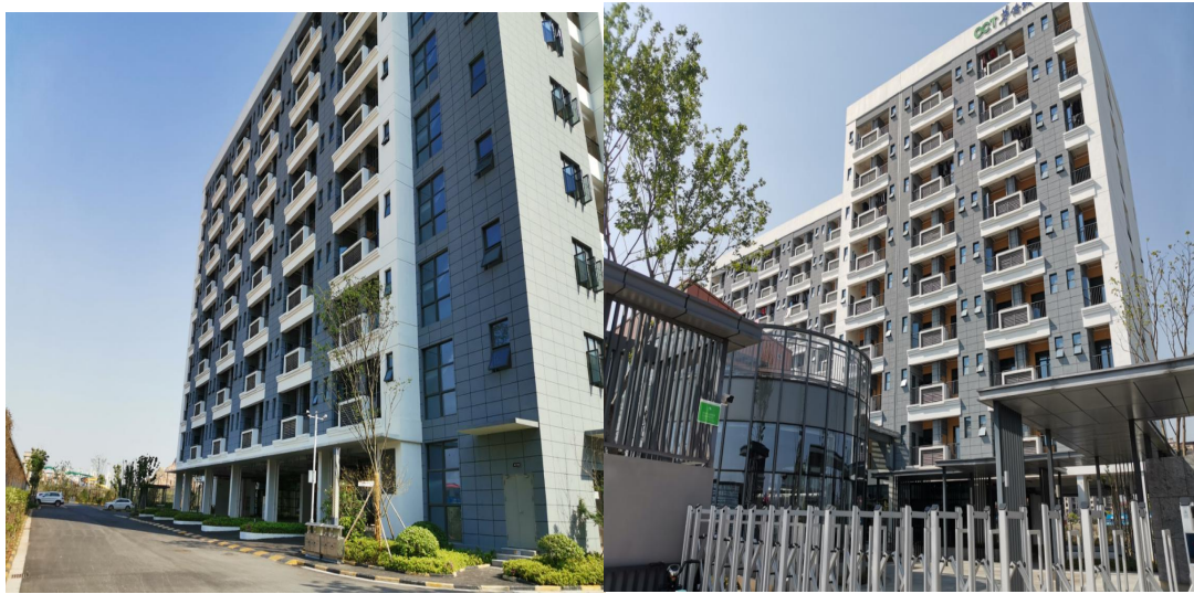
图 1-2 项目现状图（2020.4）

本项目由 1 栋员工宿舍楼、1 栋附属用房楼、一层地下室等组成，项目占地面积 9642m 2 。根据项目功能特性，本项目划分为一个主体工程区。详见下图 1-2 项目现状图。